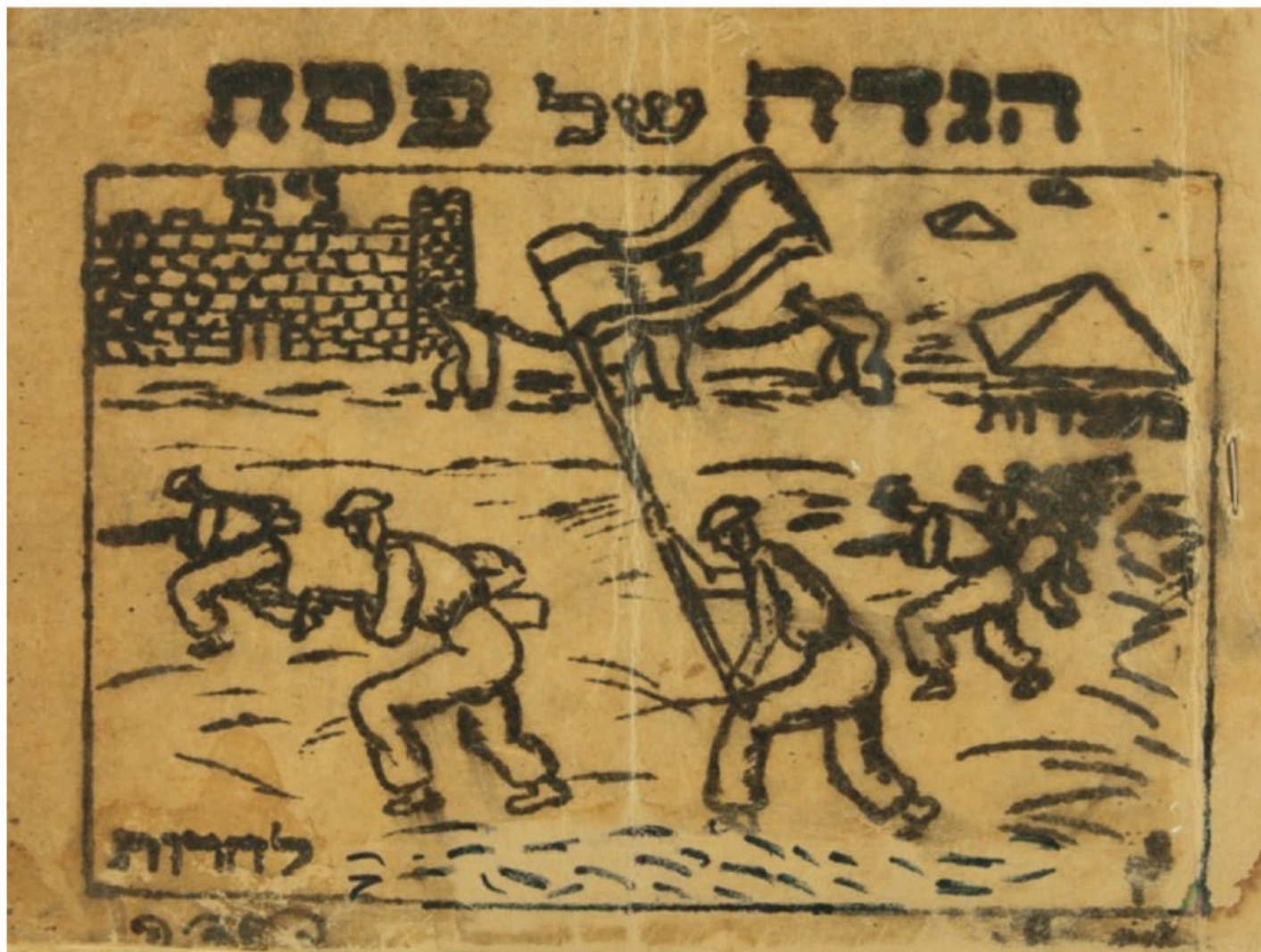
Benghazi Haggadah, Lybia, 1943