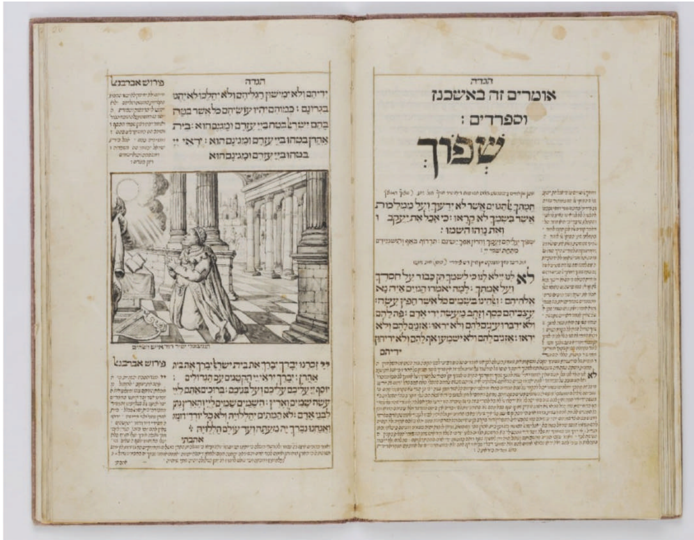
The Hamburg Haggadah, 1728, From the Rosenthaliana Collections - Special Collections of the University of Amsterdam. Digitization by Ardon Bar-Hama, The National Library of Israel. "Ktiv" Project