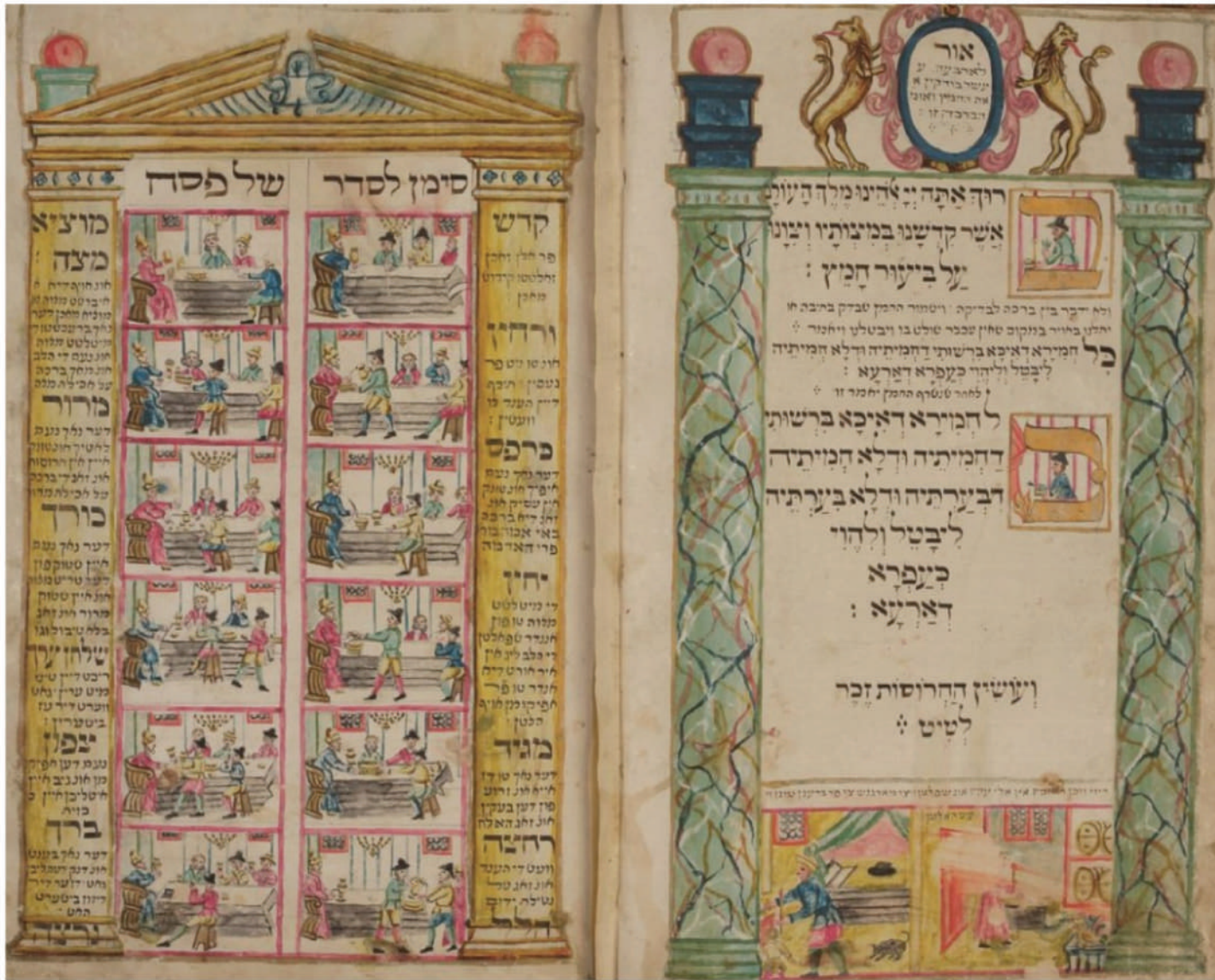
Illustrated Haggadah, Germany, 1756