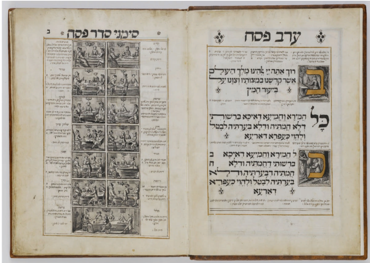
Haggadah, 1741, From the Rosenthaliana Collections - Special Collections of the University of Amsterdam. Digitization by Ardon Bar-Hama, The National Library of Israel. "Ktiv" Project