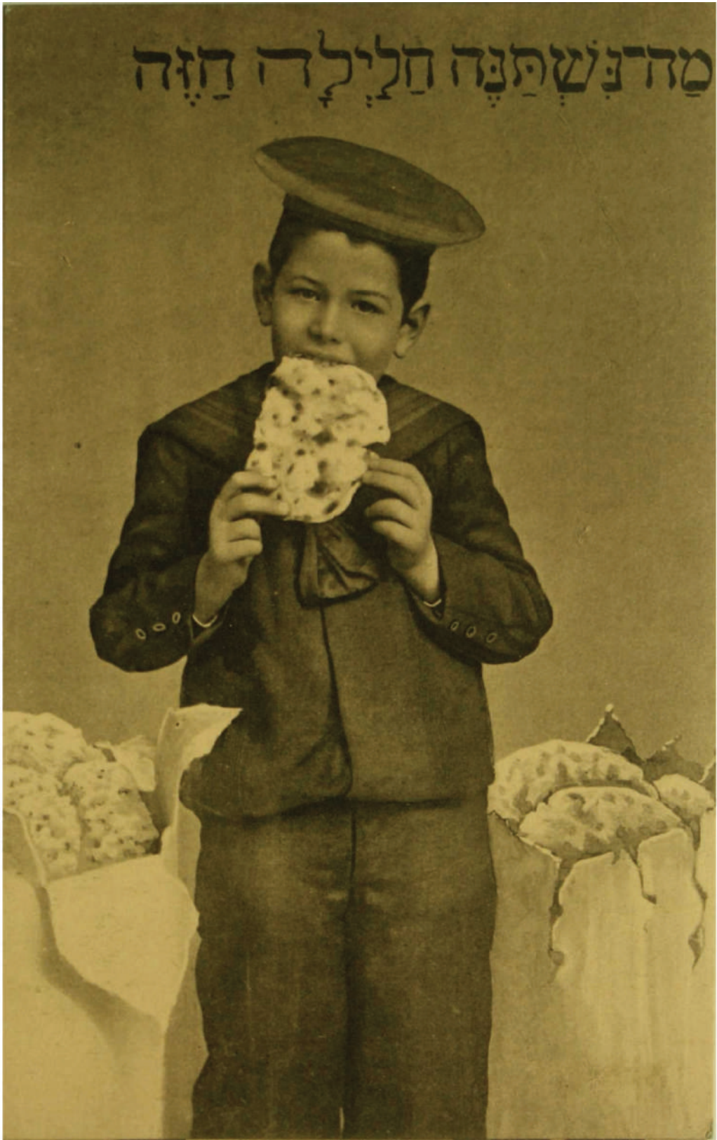
Shana Tova Card, 1950